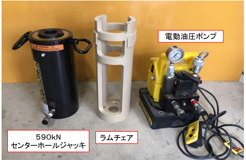
590kN センターホールジャッキ